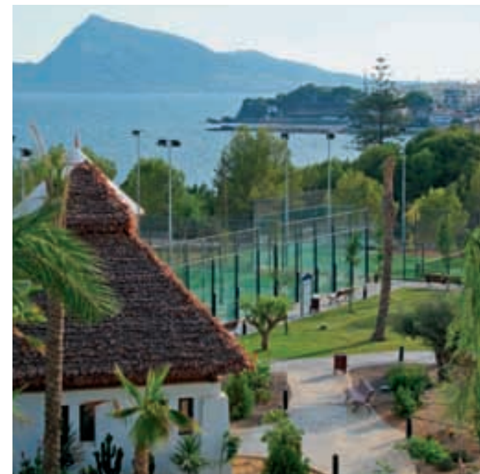
3 PISCINAS TIPO LAGO, 3 PISTAS DE PADDLE...