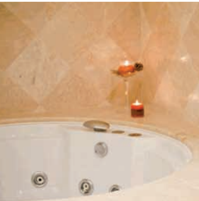
6 JUNIOR SUITES