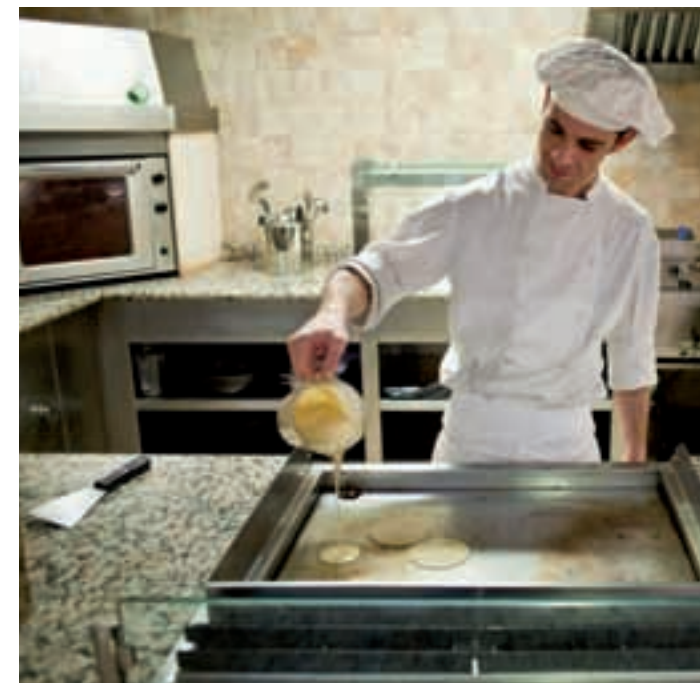
AMPLIO BUFFET DE DESAYUNO CON SHOW COOKING